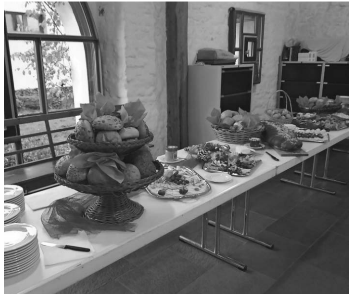
Die Bäckerei Glahs sorgte für den Gaumenschmaus.

Nun genießen die Frauen eine besinnliche Advents- und Weihnachtszeit in der Familie und dann trifft man sich wieder im neuen Jahr.