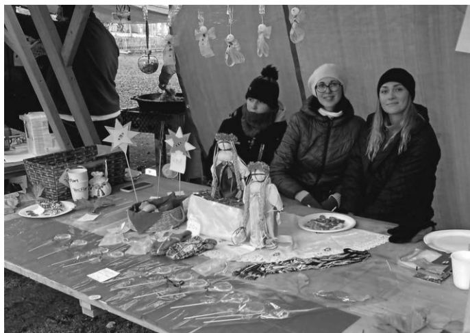
Die Frauen aus der Ukraine bieten Selbstgemachtes an.