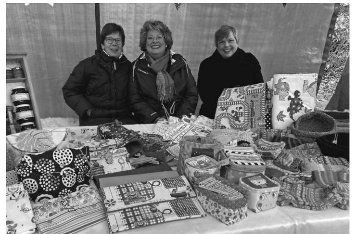
Verkaufen macht auch Spaß!

Im Pfarrrstadel sorgte der Frauenbund für Kaffee und Kuchen. Ebenso waren die Damen des Frauenbundes schon die ganze