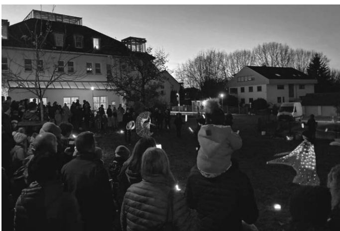
Die Kinder und Jugendlichen vom Hofzirkus zeigen ihr Können.