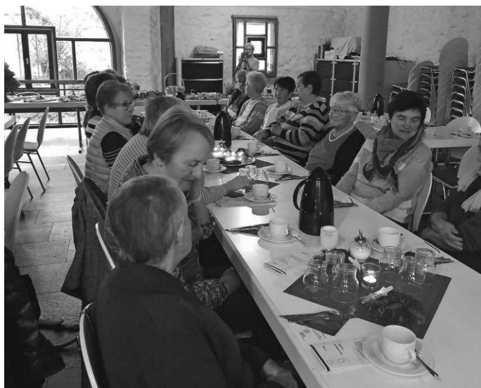
Genießen und unterhalten, das Adventsfrühstück als „Fest für alle Sinne“

Viele Gäste hatten sich im schön dekorierten Pfarrstadel eingefunden. Nach einem kleinen adventlichen Einstieg gab es Kaffee und leckeren Kuchen.