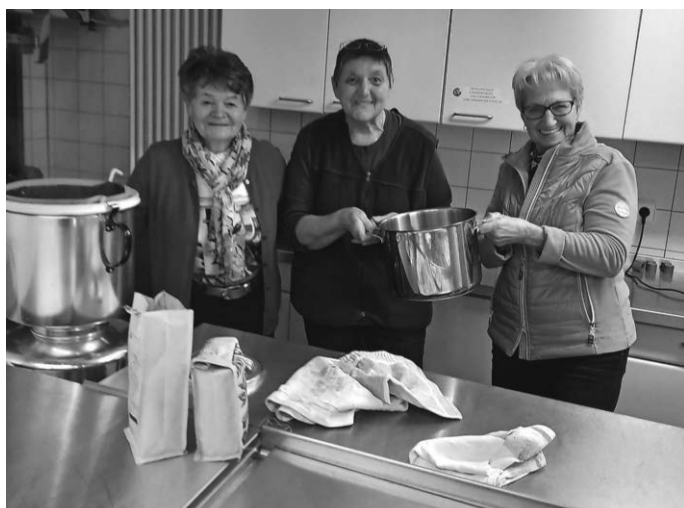
Kaffee kochen, dekorieren, bedienen und schauen, ob jeder und jede gut versorgt ist. Das perfekte Kaffeeteam bei der Vorbereitung.