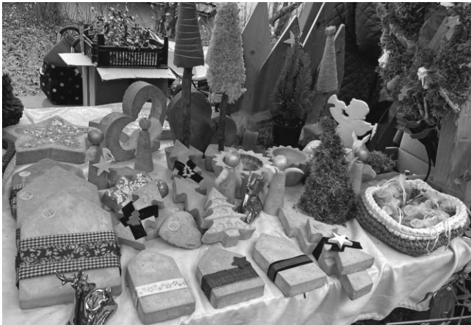
Weihnachtliches aus Beton.